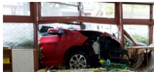
수업 중 유치원 댁친 승용차 '식당'

90대 노모, 자신을 시설에 맡기려던 70대 아들... 대통령 전용기 '코드원' 살까, 빌릴까...고민빠진 일본 16강 진출 예언한 문어가 맞이한 운명 [뉴스를부탁해]"기저귀는 현금으로 사라고요?" 손흥민이 하트 보내고 귀국하자마자 만난 연예인